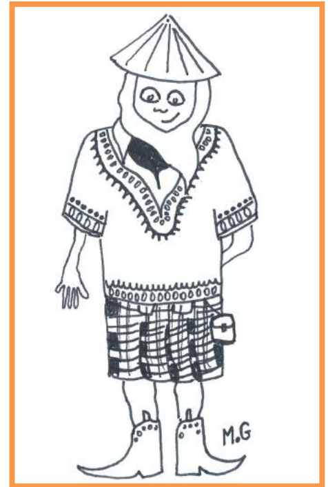
L'étudiant M2i dans toute sa splendeur

Ces deux petits « i » – interculturel et international – cachent de grands concepts à l'image de cette classe de master 2 de Nanterre qui cache de grands talents en devenir. La famille M2i est riche de par ses différences qui en font sa force. Les multiples cultures qui la composent depuis 10 ans forment une communauté interculturelle créative qui sait mener à bien des projets de grande envergure, main dans la main. C'est un bel échantillon de tolérance et de curiosité, à prendre exemple. M2i, one world, one family.