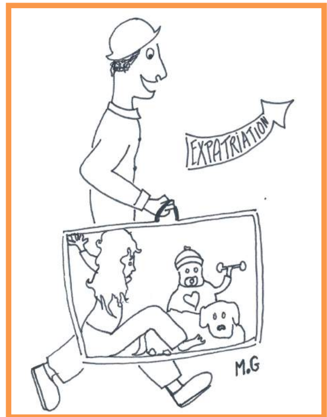
Allez, hop ! On se fait la malle !